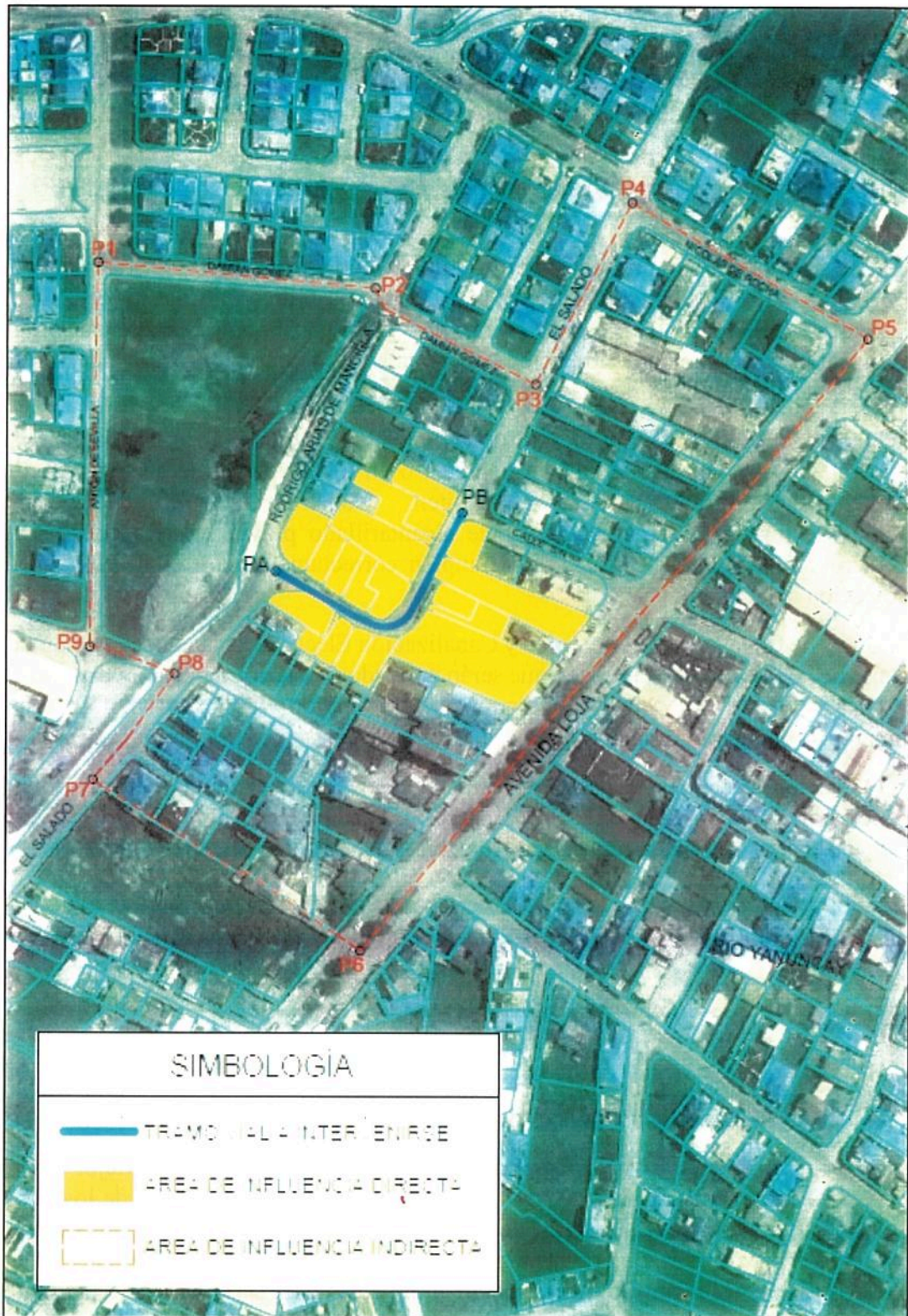
Gráfico Nro. 1 Área de influencia directa e indirecta: