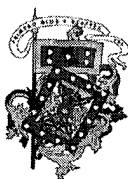
Ing. Pedro Palacios Ullauri ALCALDE DE LA CIUDAD DE CUENCA TESTIGO DE HONOR

San Roque y El Batán Teléfonos: (07) 2815 420 / 2815 800 Cuenca, Ecuador www.asm.gob.ec