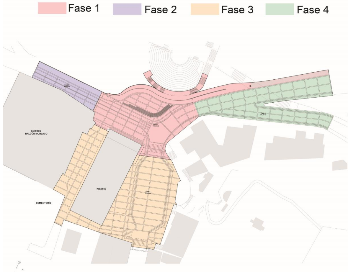
Ilustración 3. Emplazamiento general de la propuesta urbano-arquitectónica

El proyecto contempla la intervención de un área de 4614.31m 2 , cuya ejecución se plantea realizar en cuatro fases.