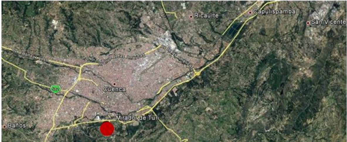
Ilustración 1. Ubicación con respecto a la ciudad de Cuenca

La parroquia está ubicada a cuatro kilómetros al sur de la capital del Azuay, Cuenca; su principal vía de acceso es la avenida 24 de Mayo.