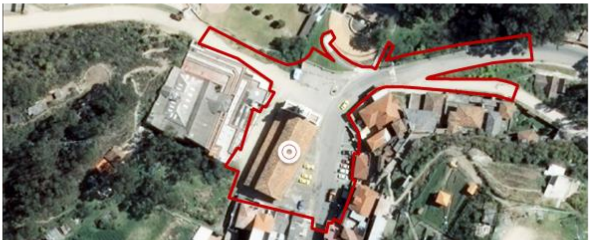
Ilustración 2. Área de intervención del proyecto