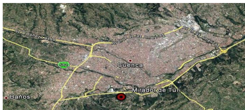
Figura 3.1: Ubicación