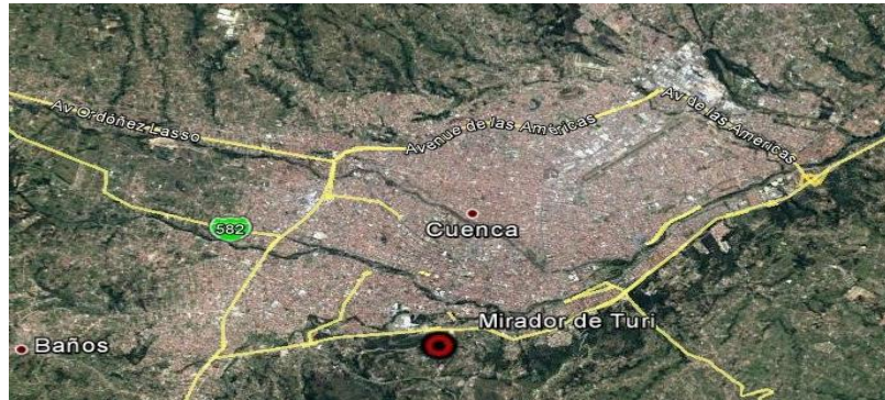
Ilustración 1 Ubicación espacial del proyecto

El proyecto se emplazará en terrenos de propiedad municipal, en la parroquia rural Turi, al sur de Cuenca, en el sector donde se ubica el actual Mirador y en las zonas aledañas a la Iglesia.