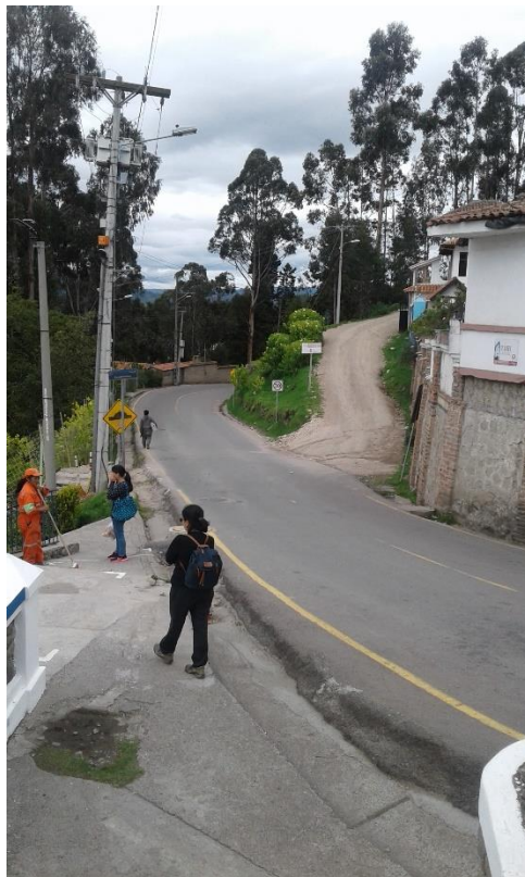
Ilustración 4 Zona a intervenir para el retiro de asfalto